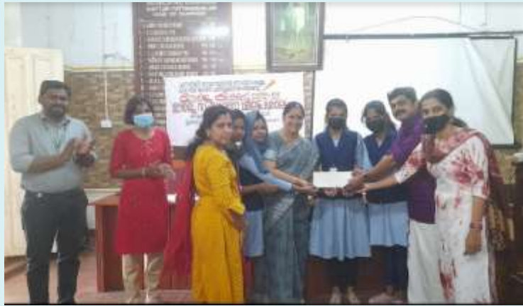
First prize- GVHSS, Nemmara

ഉർജ്ജകിരൺ ഹ്രസ്വ വീഡിയോ നിർമ്മാണ മത്സരം ചിറ്റൂർ: എനർജി മാനേജ്മെന്റ് സെന്റർ കേരളയും സെന്റർ ഫോർ എൻവയോൺമെന്റും സംയുക്തമായി സംഘടിപ്പിക്കുന്ന ഉർജ്ജ കിരൺ 2022-23 സംസ്ഥാന തല ഉർജ്ജ സംരക്ഷണ ഘോഷവൽകരണ പരിപാടിയുടെ ഭാഗമായി ഹ്രസ്വ വീഡിയോ നിർമ്മാണ മത്സരത്തിലേക്ക് എൻ്റികൾ ക്ഷണിച്ചു. ജീവിത ശൈലിയും ഉർജ്ജ കാര്യങ്ങളിലും എന്ന വിഷയത്തിലൂന്നി ഉർജ്ജ സംരക്ഷണം ജനമധ്യമങ്ങളിലേക്കെത്തിക്കുന്ന വീഡിയോ മൂന്നു മിനിറ്റിൽ കവിയാത്ത വീഡിയോകളാണ് നിർമ്മിക്കേണ്ടത്. ഒന്ന്, രണ്ട് സ്ഥാനം ലഭിക്കുന്നവർക്ക് യഥാക്രമം 3000, 2000 രൂപ സമ്മാനം ലഭിക്കും. ചിറ്റൂർ താലൂക്കിലുള്ളവർക്കായി ചിറ്റൂർ ഗവൺമെന്റ് കോളജാണ് മത്സരങ്ങൾ സംഘടിപ്പിക്കുന്നത്. എൻ്റികൾ തയ്യാറാക്കേണ്ടതിനും വിശദവിവരങ്ങൾക്കും 9745834307. അവസാന തീയതി ജനുവരി 3.